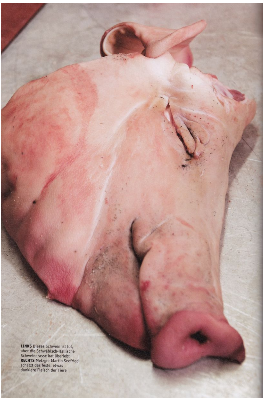
LINKS Dieses Schwein ist tot, aber die Schwäbisch-Hällische Schweinerasse hat überlebt RECHTS Metzger Martin Seefried schätzt das feste, etwas dunklere Fleisch der Tiere